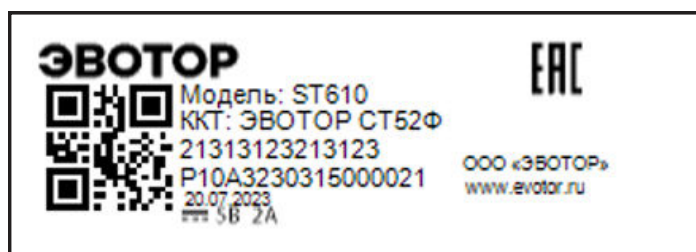
Рисунок 3. Пример маркировочного шильда