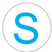
Рисунок 1. Изображение пломбы